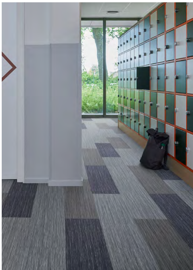
Flotex lames wood silver wood et grey wood