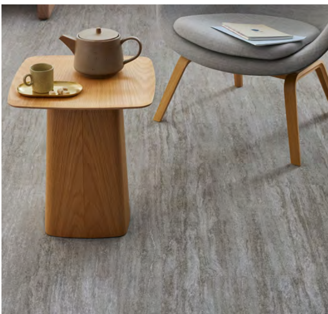
Flotex lames sierra cascade