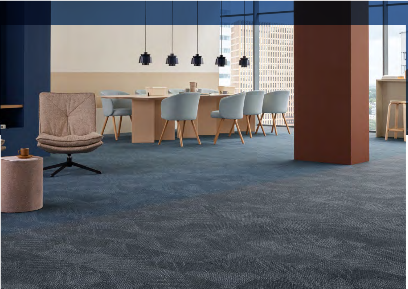
Flotex lames serif alloy et iron